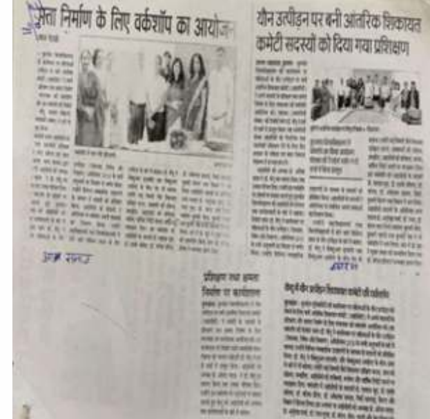
Organized Workshop on "Gender sensitivity and prevention of sexual harassment".