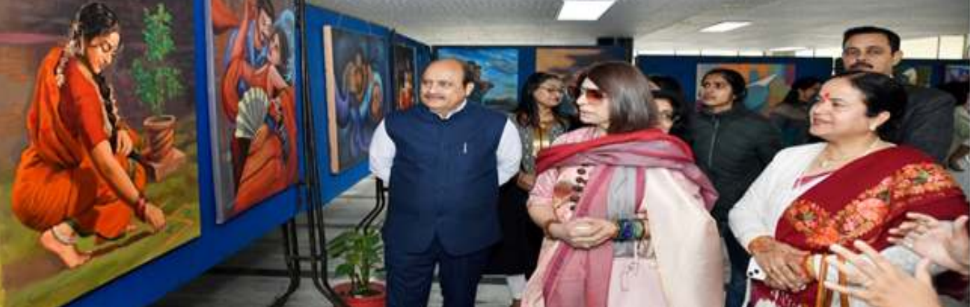
Poster Exhibition of Internal Complaints Committee