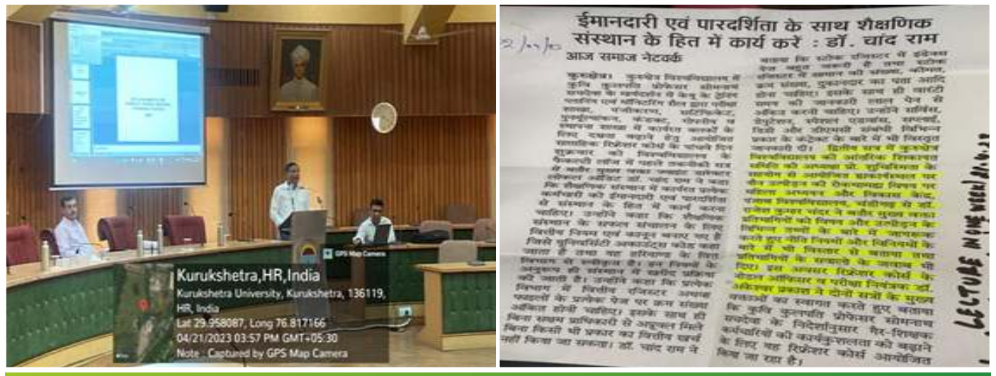
Lecture on "Awareness against sexual Harassment of Women at Workplace.