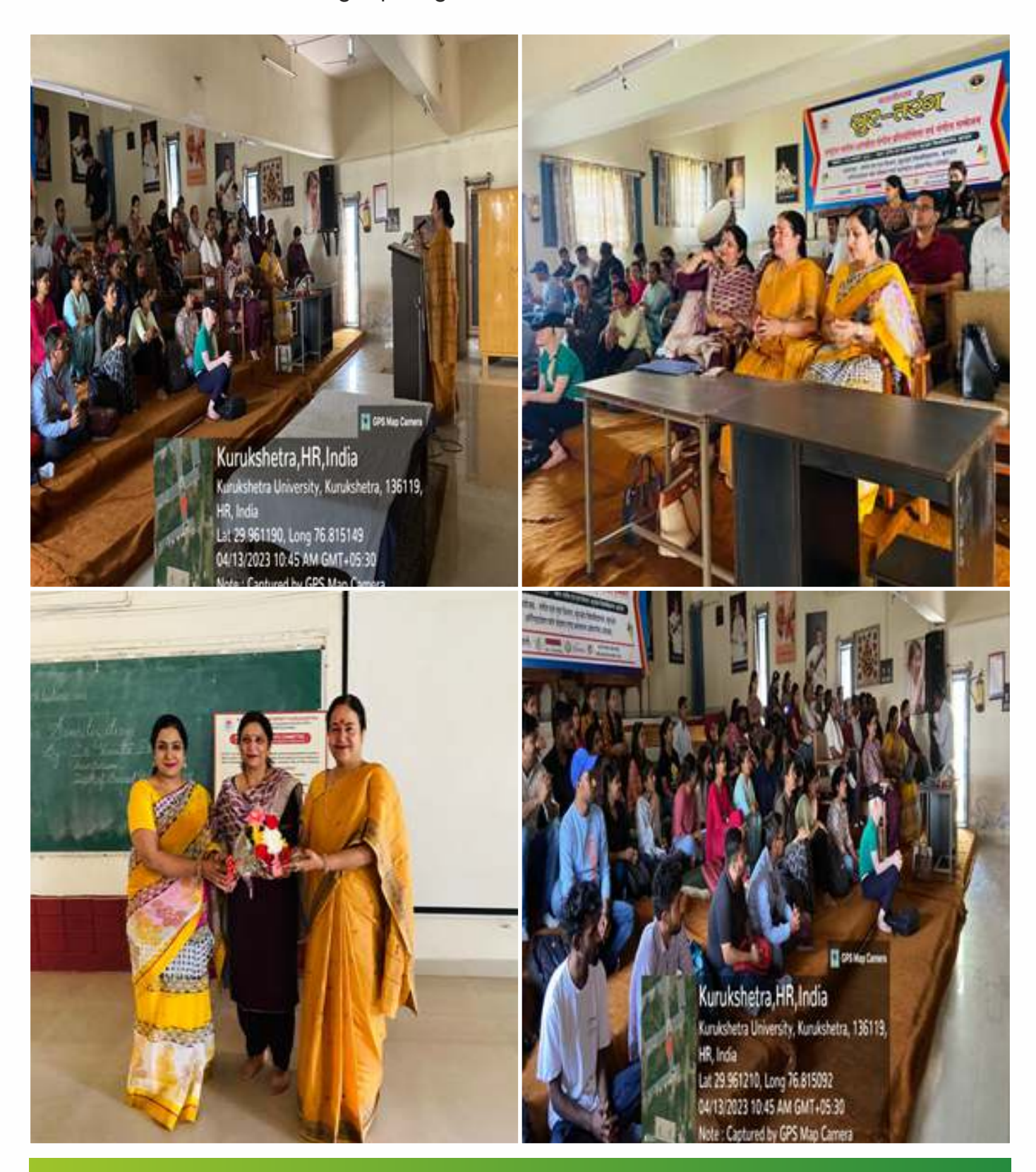
Lecture in the Department of Music and Dance on the topic "Gender Sensitization".

A LECTURE ORGANISED BY ICC IN DEPARTMENT OF MUSIC AND DANCE ON "GENDER SENSITIZATION" TO CREATE AWARENESS AGAINST SEXUAL HARASSMENT OF WOMEN AT WOEKPLACE 13-04-2023.