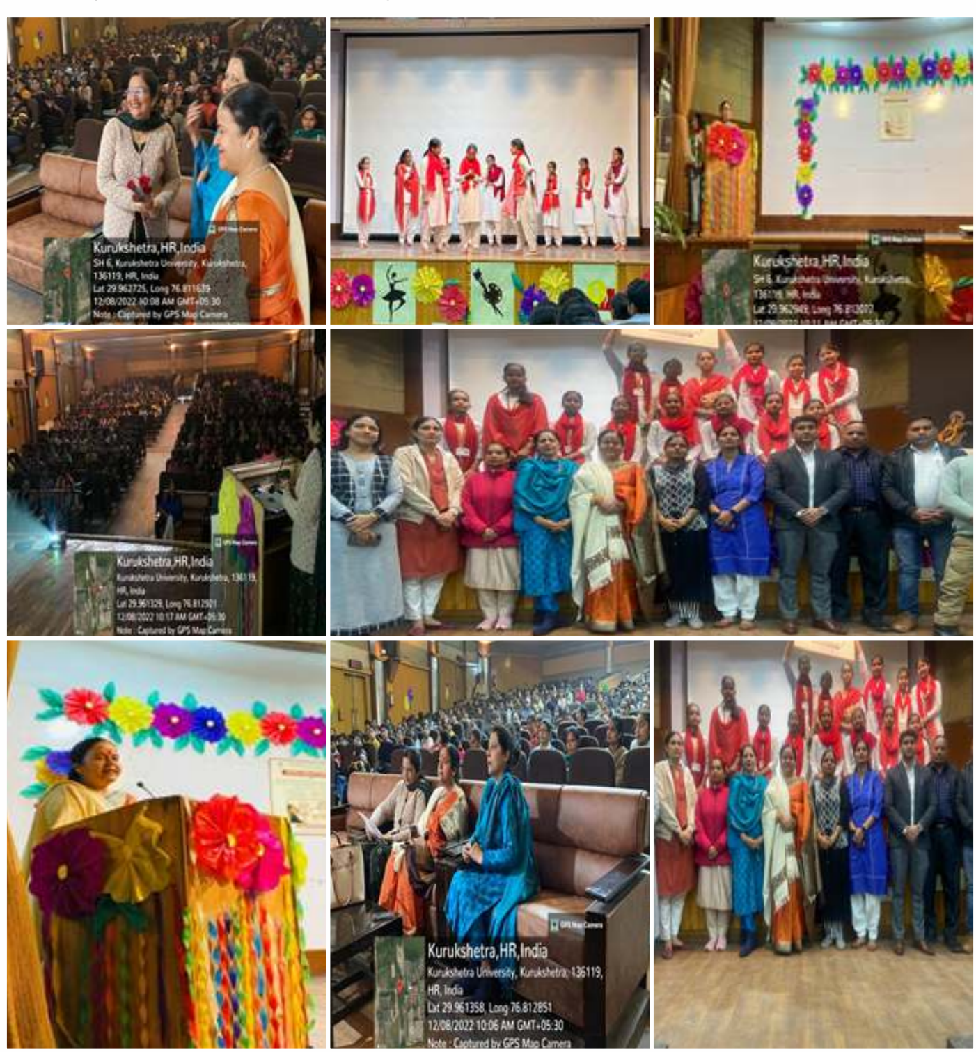
Delivered Lecture and Nukkad Natak in collaboration with University Senior Secondary Model School, KUK in the Institute of Teacher Training & Research

Delivered Lecture and Nukkad Natak in collaboration with University Senior Secondary Model School, KUK on Gender Sensitization to create awareness against "Sexual Harassment of Women at Workplace (Prevention, prohibition and redressal) Act 2013, in the Institute of Teacher Training & Research, Kurukshetra University, Kurukshetra for faculty, students and non-teaching Staff on 08th December, 2022.